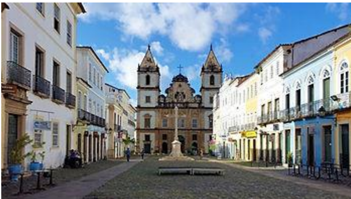
Largo do Cruzeiro e Igreja de São Francisco

Dentre tantas igrejas que existem na cidade, esta é uma das mais especiais. Toda a ornamentação do templo é feita em ouro, uma das mais lindas expressões do estilo Barroco no Brasil.