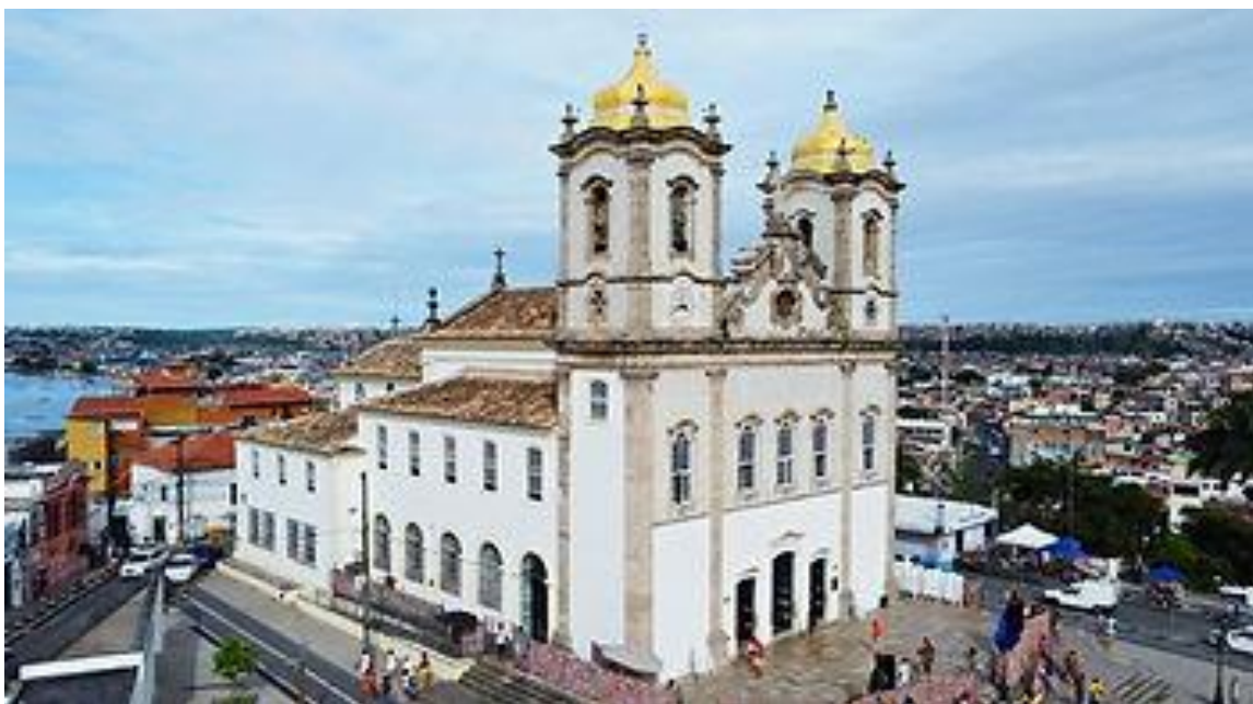
A sagrada colina da Igreja do Bonfim