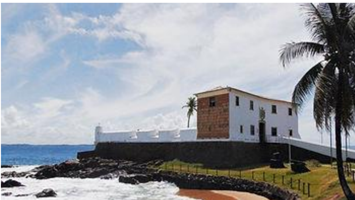
O pequenino Forte Santa Maria