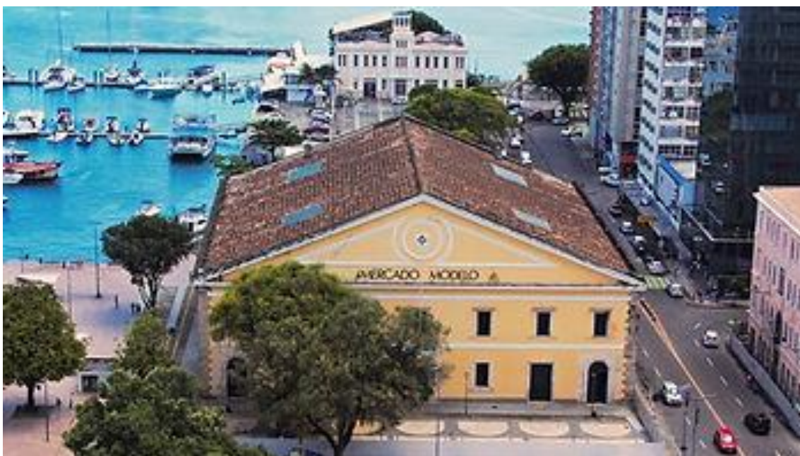
Vista aérea do Mercado Modelo

O Mercado Modelo conta com quase 300 lojas e oferece inúmeras opções de souvenirs e lembranças, reforçando a diversidade cultural baiana. A estrutura é considerada por muitos como o maior shopping de artesanato do Brasil. Para quem deseja passar o dia no local, o Mercado Modelo também oferece dois ótimos restaurantes localizados no pavimento superior.