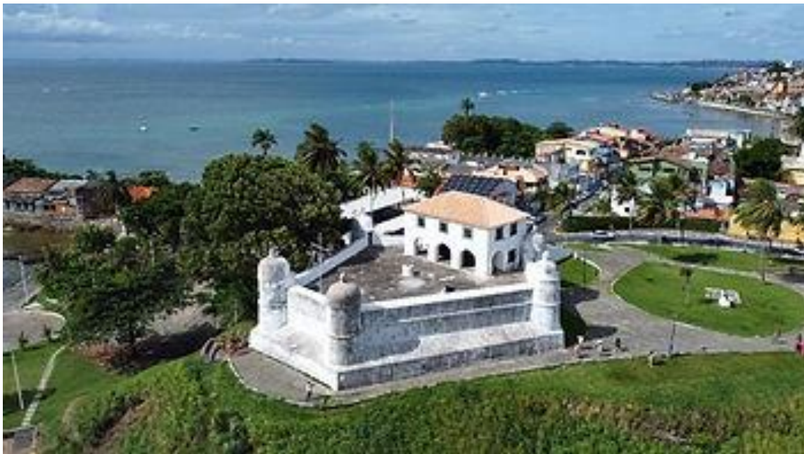
Vista aérea do Forte Monte Serrat

O Forte de Nossa Senhora de Monte Serrat tem muita história. Em outras palavras, o local é considerado por muitos como uma das estruturas militares mais importantes para o período colonial no Brasil.