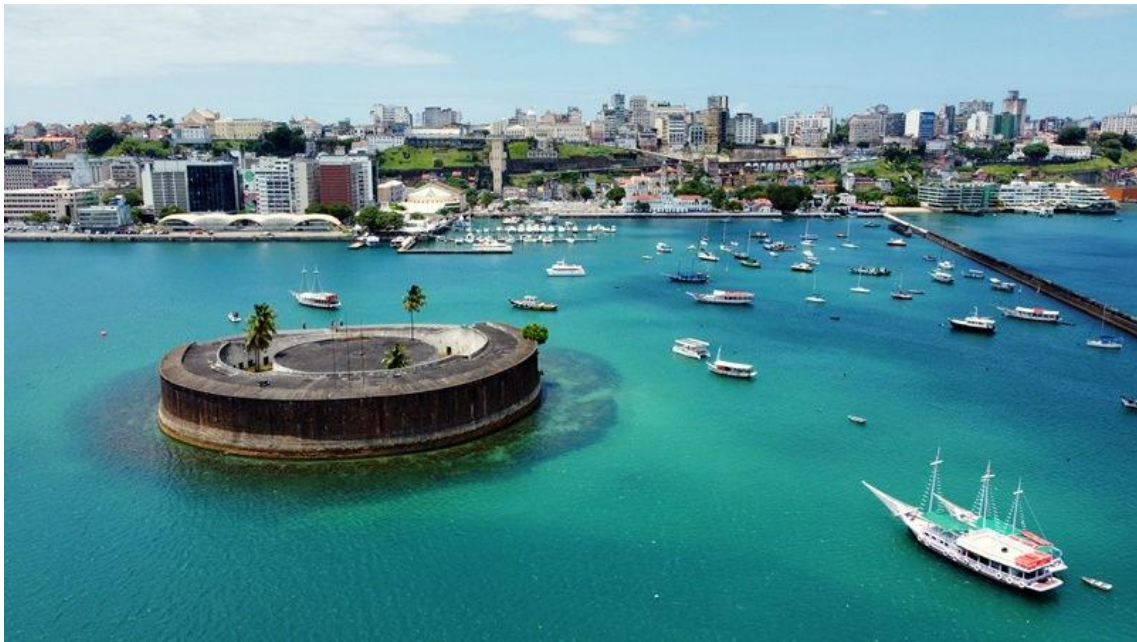
Vista aérea de Salvador com Forte São Marcelo e centro histórico ao fundo

SALVADOR Fundada em 1549, Salvador foi a primeira capital do Brasil e é uma cidade turística que atrai muitos visitantes durante todo o ano. Como oferece uma grande variedade de atrações, faz-se necessário conhecer as principais, de modo a garantir diversão e uma melhor imersão nas vivências locais. Não é segredo que as pessoas brasileiras e estrangeiras têm curiosidade para conhecer os diferentes passeios da região.