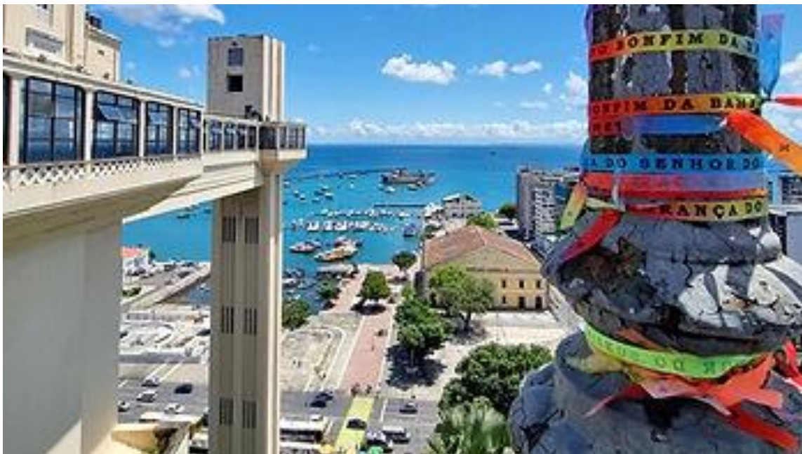
A vista maravilhosa do Elevador Lacerda

O Elevador Lacerda possui 72 metros de altura e liga a Cidade Baixa à Cidade Alta. Além da sua função de transporte urbano, o impressionante monumento permite uma visão privilegiada da Baía de Todos os Santos e de vários outros pontos da cidade. Quem vai ao Centro Histórico pode utilizá-lo para se deslocar, posteriormente, ao Mercado Modelo .