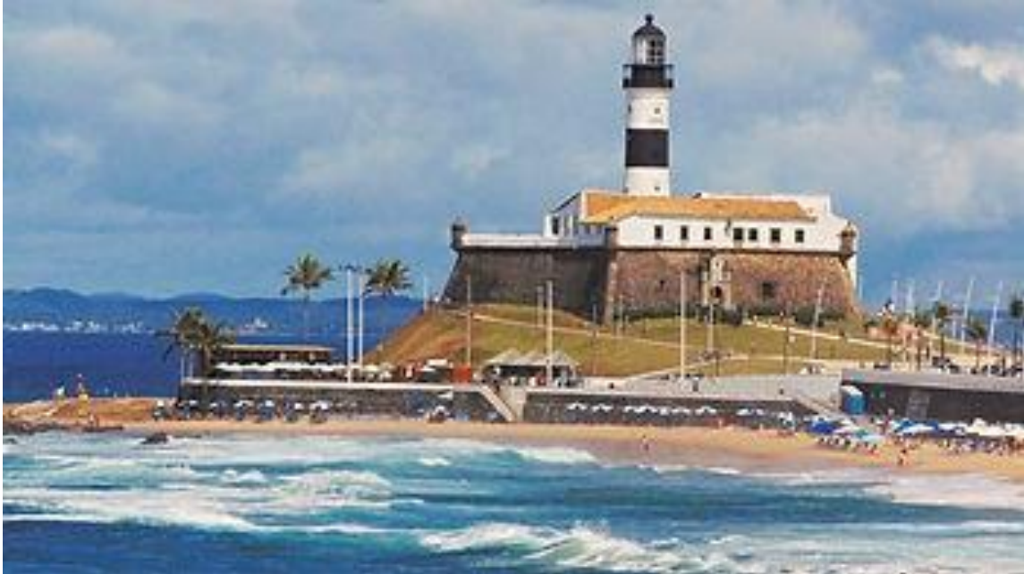
O majestoso Forte Santo Antônio e Farol da Barra

O Farol da Barra está instalado dentro do Forte Santo Antônio , considerado uma das mais antigas fortificações do país. É um dos principais cartões postais do Brasil, local de grande inspiração e incrível beleza natural, com sua maravilhosa vista da entrada da Baía de Todos os Santos.