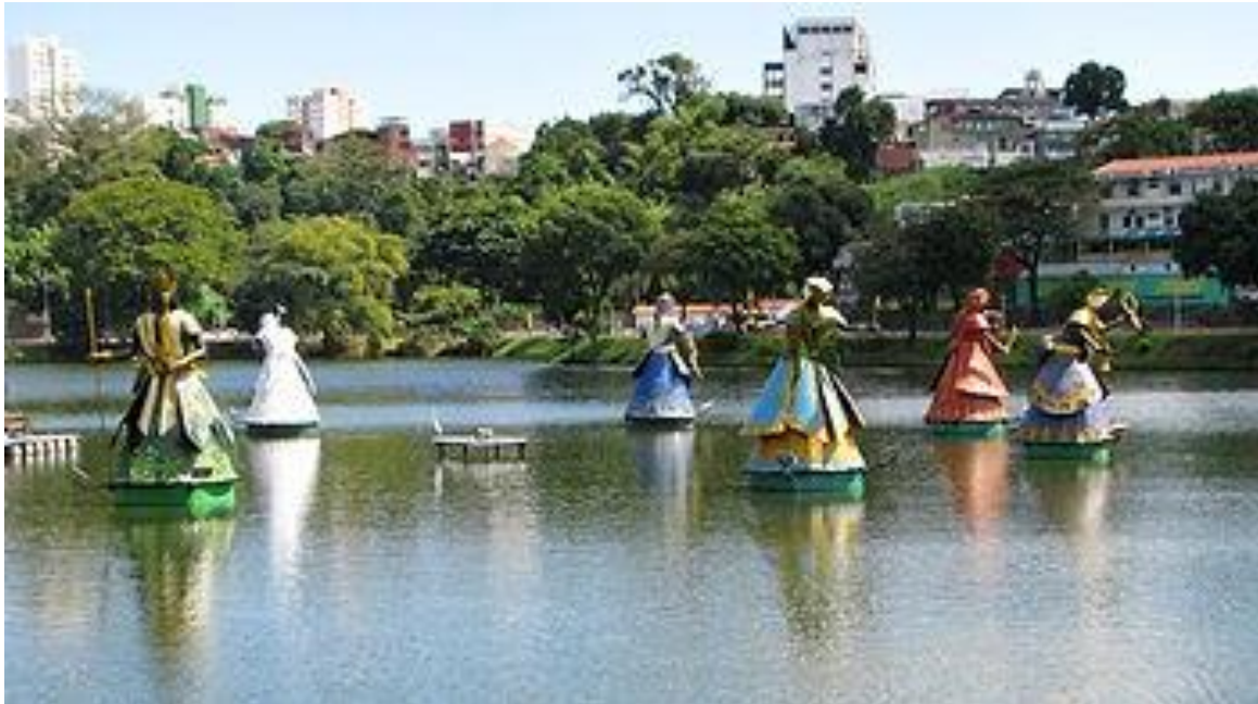
As famosas estátuas dos orixás no Dique do Tororó

O Dique do Tororó é formado por uma lagoa de aproximadamente 110 mil metros cúbicos de água. Nesse local, estão as estátuas de oito orixás do Candomblé , em um tributo a uma das principais manifestações religiosas da Bahia.